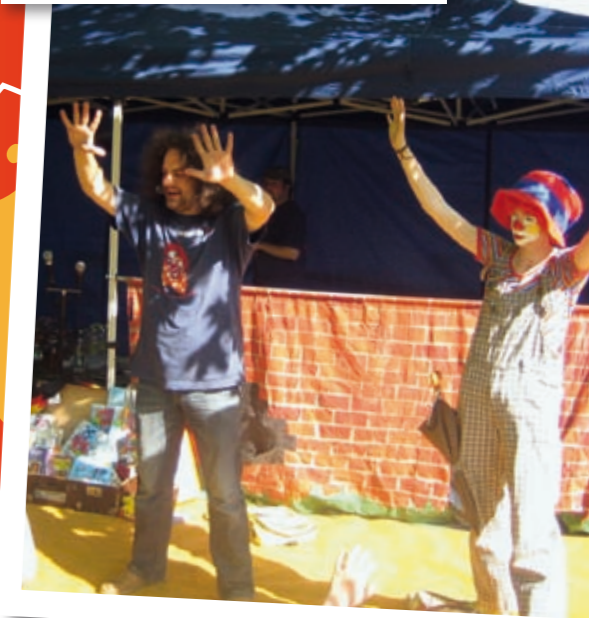
Mit mobiler Bühne, Clown und Spielkiste geht's raus auf die Straße.

Dresden 1993. Die Neustadt als Viertel der Trostlosigkeit und des Verfalls. Drei Jahre nach der Wende dominieren hier Unrat, bröckelnde Fassaden, Verwahrlosung und Perspektivlosigkeit das Bild des Viertels und die Seelen der Bewohner.