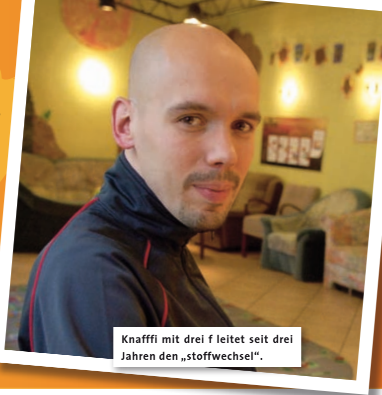
Knafffi mit drei f leitet seit drei Jahren den „stoffwechsel“.

15 Jahre „stoffwechsel“ in Dresden: Zehn Projekte in vier Stadtteilen