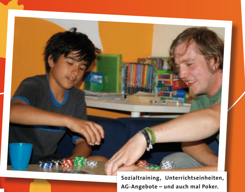
Sozialtraining, Unterrichtseinheiten, AG-Angebote – und auch mal Poker.