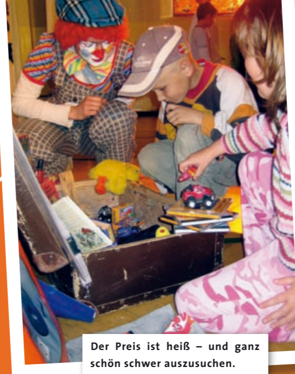
Der Preis ist heiß – und ganz schön schwer auszusuchen.