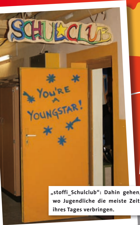
„stoffi_Schulclub“: Dahin gehen, wo Jugendliche die meiste Zeit ihres Tages verbringen.