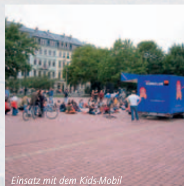
Einsatz mit dem Kids-Mobil