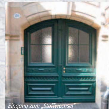
Eingang zum „Stoffwechsel“