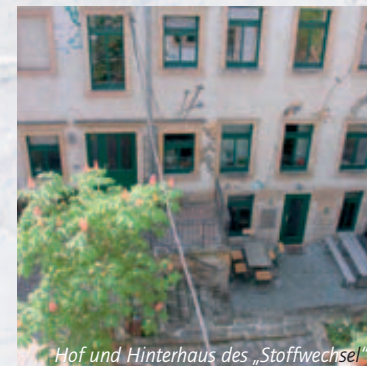
Hof und Hinterhaus des „Stoffwechsel“